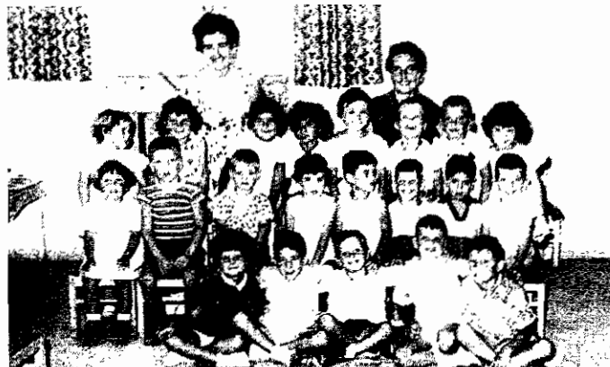
גן ובית-ספר במושב